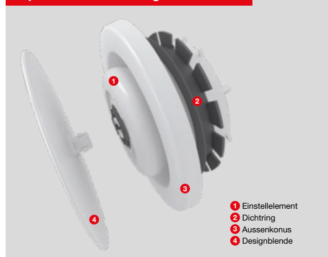
Explosionsdarstellung Zehnder ComfoValve Luna E