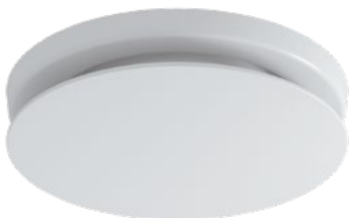
Zehnder ComfoValve Luna E125

Abluft-Tellerventil Technische Spezifikation 096