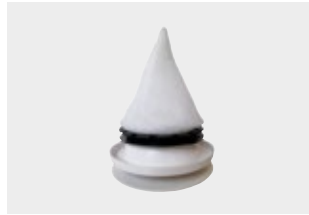
Filter zu Zehnder ComfoValve Luna E